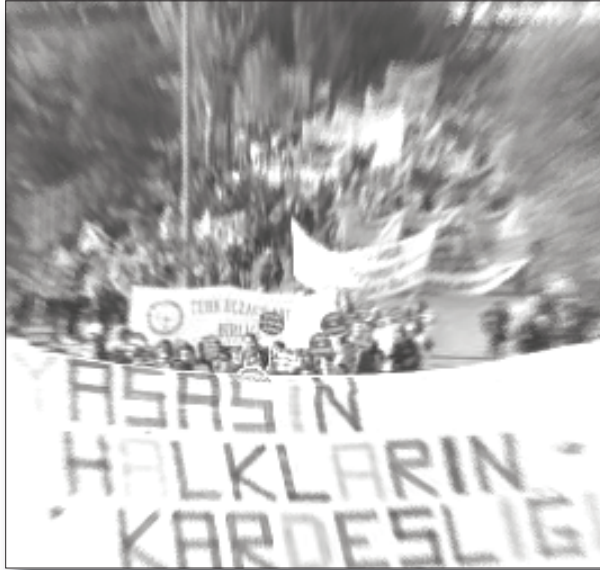
Şovenizmin yükselme zemini

Ancak aynı döneme denk gelen bahar eylemleri şoven havayı dağıtmada önemli bir rol oynadı. Sınıfın hak arama mücadelesini yükseltmesi şoven kudurganlığı bir nebze engelledi. Ancak bu süreçte gerek Kürt ulusal hareketi, gerekse Türkiye sol hareketi cephesinden yapılan yanlışlar bahar eylemlerinin geri çekilmesiyle birlikte şovenizmin tırmanmasına yol açtı. Bu süreç 2000'li yıllarda Kürtler'e dönük linçlere kadar vardı.